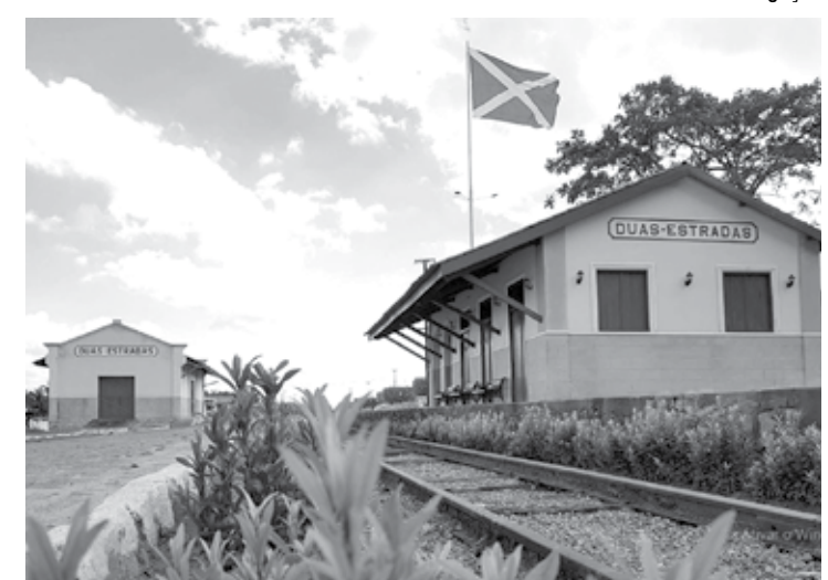
Estação Ferroviária será palco de uma cerimônia de boas vindas nesta sexta

No domingo, as atividades culturais têm início pela manhã com exposição fotográfica e passeio pelas principais ruas de Duas Estradas (Nos Trilhos da Cidade). Às 10h, está prevista uma visita ao Engenho Imaculada Conceição que produz a cachaça Serra Limpa. A saída está confirmada na frente da estação ferroviária. Após o almoço, por volta das 14h30, acontece uma visita guiada nas dependências da igreja Sagrado Coração de Jesus. Em