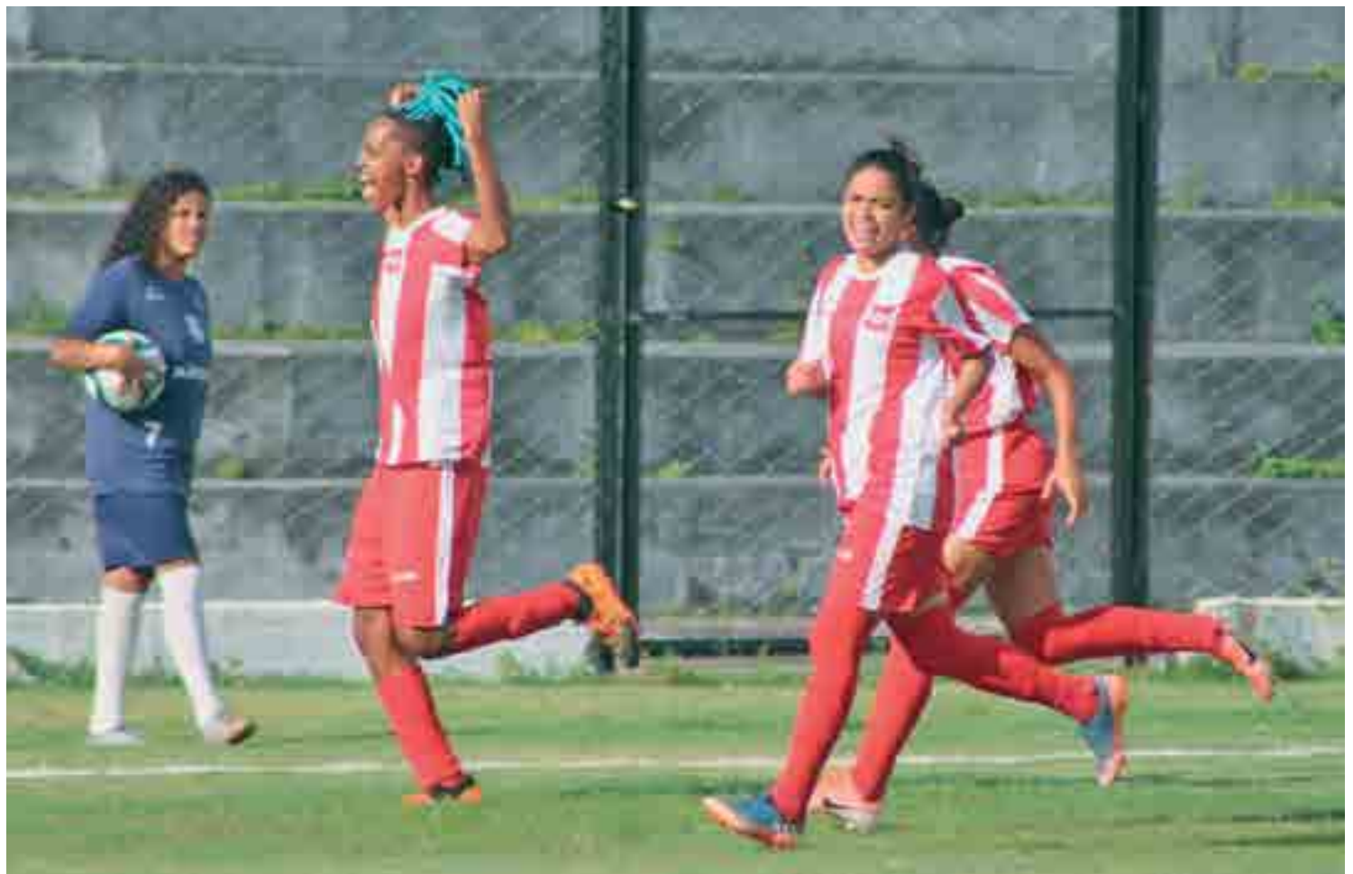
No futebol feminino, o Auto Esporte brilhou no Presidente Vargas e derrotou o Treze por 5 a 0, em mais uma rodada do Campeonato Paraibano 2019