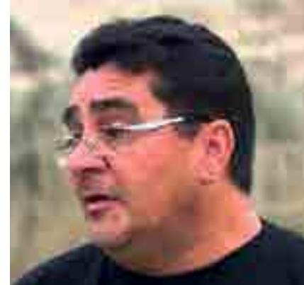
Juvandi de Souza: cidade multicultural

mas chegou a alçar voos sendo ministro do Tribunal de Contas da União e senador da República.