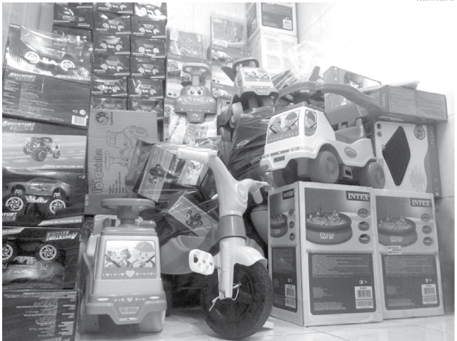
Até ontem, 302 itens já haviam sido apreendidos tanto em lojas do Centro de João Pessoa, como em shoppings centers. Lojas podem ser punidas com multas

Com pouco tempo de comprar o presente para o Dia das Crianças, muitos pais acabam não verificando os detalhes que garantem a segurança do produto como o Selo de Qualidade do Inmetro. Sem esse carimbo do instituto, a pessoa pode comprar algo fora das especificidades de segurança, apresentando, assim, o risco de acontecer algum acidente com a criança.