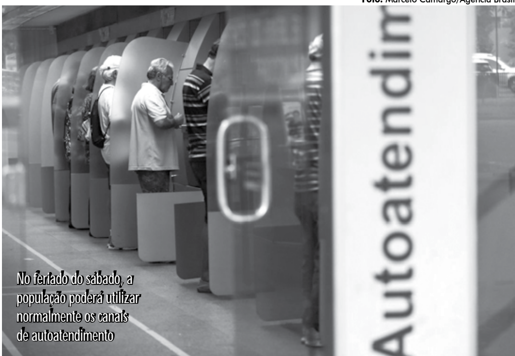
No feriado do sábado, a população poderá utilizar normalmente os canais de autoatendimento

Na capital, existem 18 mercados públicos e praticamente todos estarão funcionando no feriado do sábado, a exemplo dos mercados do Castelo Branco; Tambaú, Bessa e Grotão entre outros