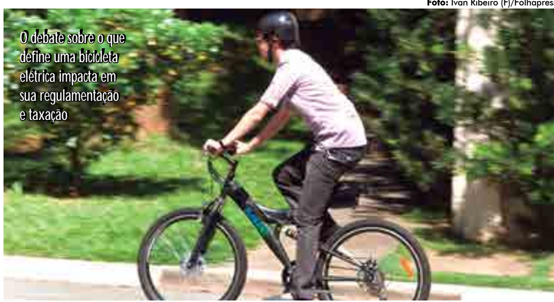
O debate sobre o que define uma bicicleta elétrica impacta em sua regulamentação e taxação

O debate sobre o que define uma bicicleta elétrica impacta a forma como esses veí-