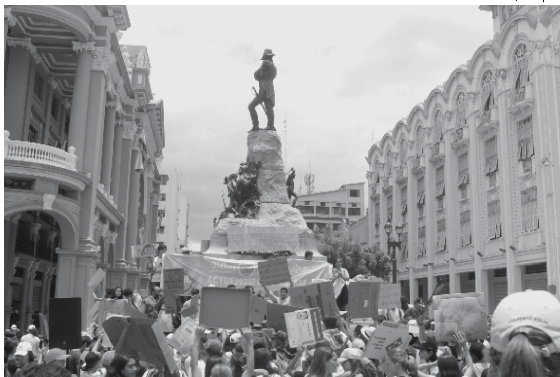
O presidente do Equador, Lenín Moreno, decidiu transferir a capital do país para Guayaquil devido aos protestos

O levante, o pior no Equador em anos, ocorre devido a um acordo assinado com o Fundo Monetário Internacional