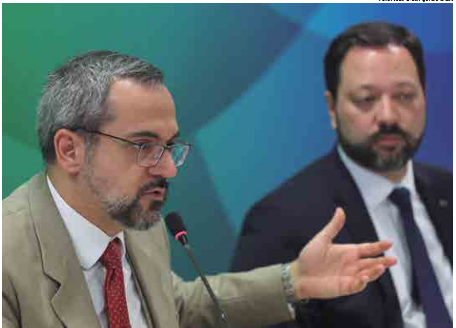
O ministro da Educação, Abraham Weintraub, e o presidente do Inep, Alexandre Lopes, falaram ontem à imprensa sobre os preparativos para o Enem

Para colocar o Enem de pé é necessária uma megaoperação de logística e segurança. São 400 mil profissionais envolvidos em todo o processo da avaliação. Só a operação de transporte dos malotes envolve 31 mil colaboradores, a maioria, agen-