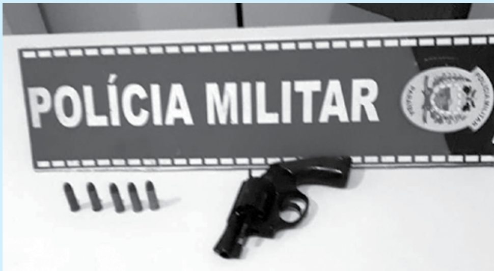
Suspeitos, de acordo com a Polícia Militar, atuavam pelo Sertão da Paraíba

Em ações no Sertão do Estado, na noite dessa quarta-feira (9), a Polícia Militar apreendeu uma arma de fogo, porções de drogas e prendeu dois suspeitos nos municípios de Aguiar e Princesa Isabel.