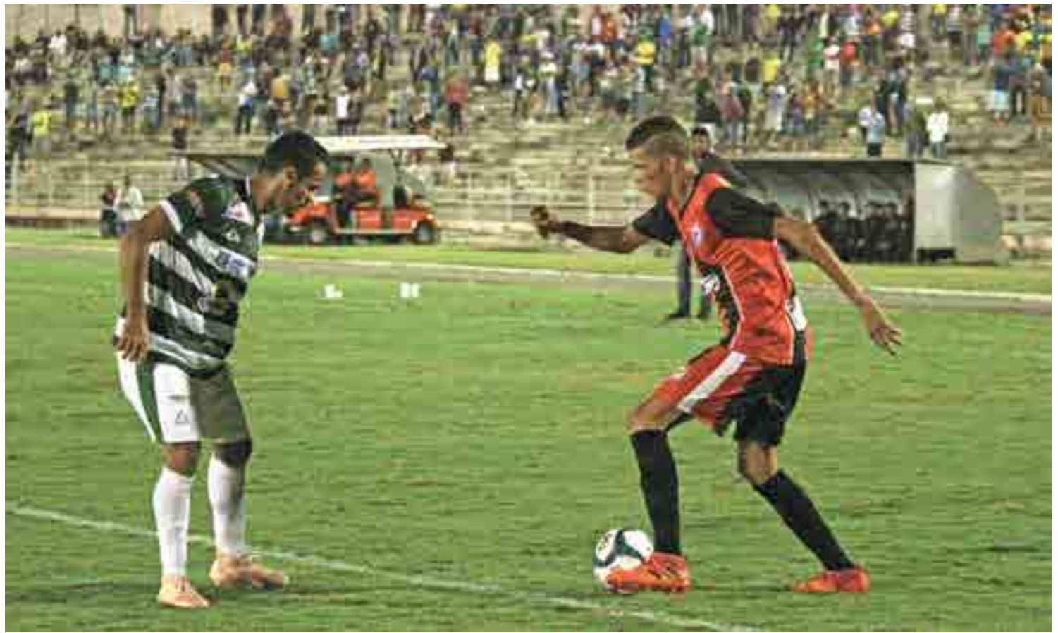
Sport Lagoa Seca e São Paulo Crystal empataram em 2 a 2 no primeiro jogo decisivo do Campeonato Paraibano da Segunda Divisão, disputado no Amigão

“O resultado do jogo não será mudado, não adianta recorrer nesse sentido. Não vejo responsabilidade direta da Federação Paraibana de Futebol nesse episódio”