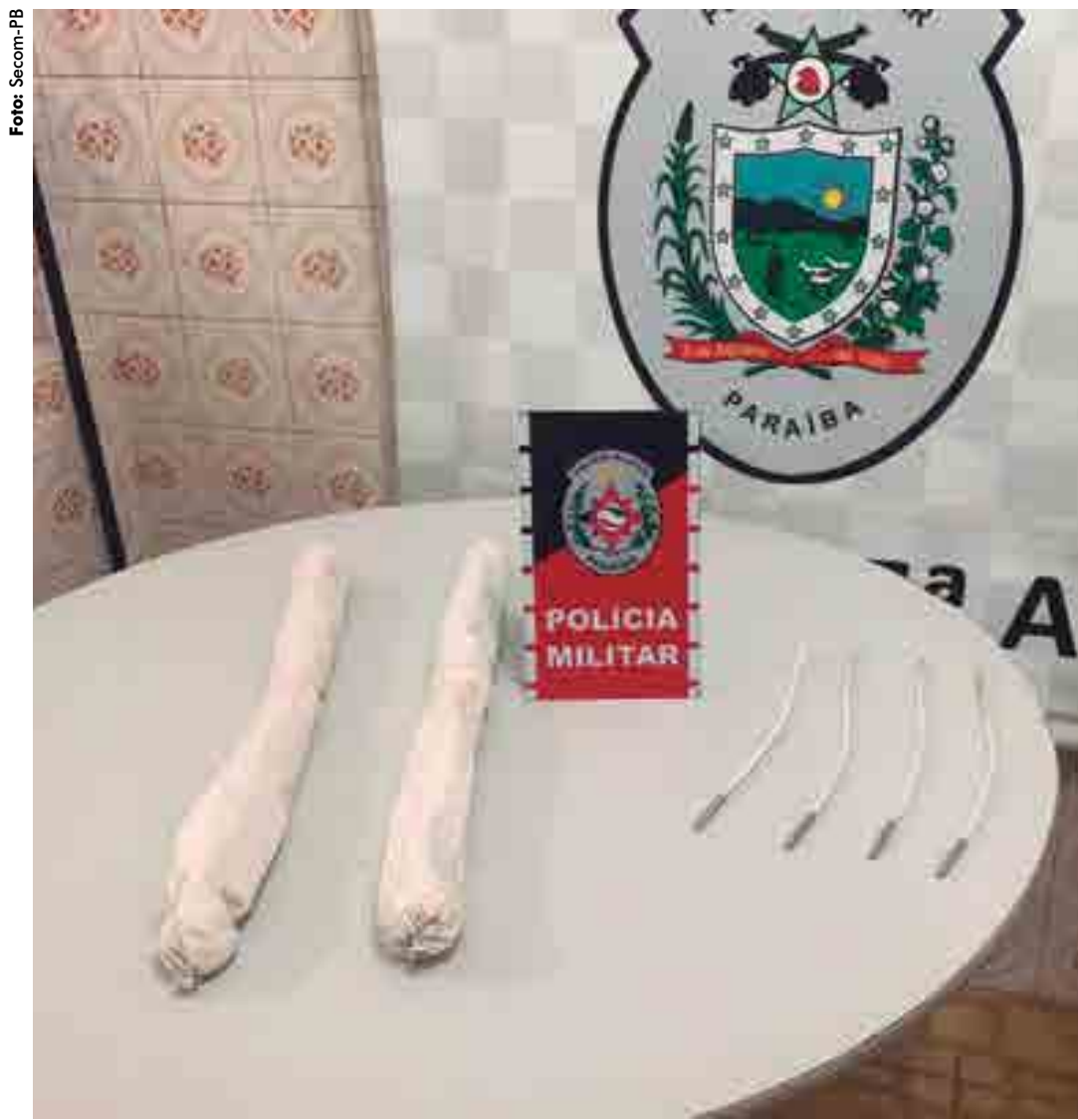
Os dois encartuchados de emulsão explosiva, quatro cordéis detonantes e espoletas foram localizados em uma sacola

Em mais uma ação contra grupos que atacam instituições financeiras, a Polícia Militar apreendeu explosivos que provavelmente seriam utilizados contra bancos, caixas eletrônicos ou cofres. Os explosivos estavam em uma casa e foram encontrados pela PM, no fim da tarde de ontem, no distrito de Camaratuba, município de Mamanguape, no Litoral Norte do Estado.