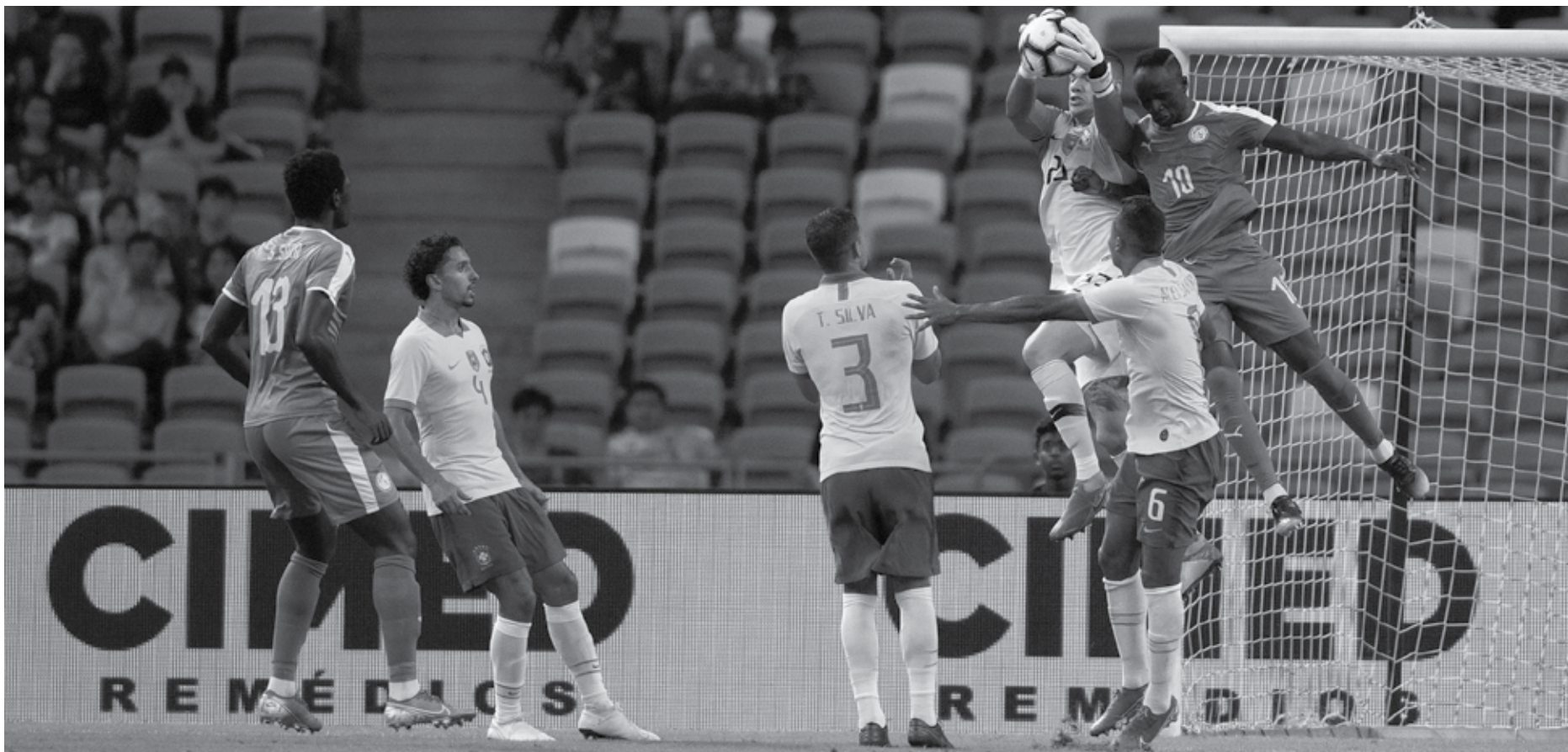
O goleiro brasileiro Ederson e a defesa foram bastantes exigidos diante de uma exibição bem abaixo dos padrões da equipe comandada por Tite que novamente foi bastante criticado

O camisa 10 da Seleção Brasileira não foi um dos destaques do confronto. Fazendo seu 100º jogo com a camisa do Brasil, Neymar ainda não parece estar na melhor forma após a lesão no tornozelo direito sofrida na preparação para a Copa América. Menos explosivo do que habitualmente, enfrentou poucas vezes os marcadores em situações de um contra um e sentiu um pouco a falta de ritmo. Teve boa oportunidade no fim do primeiro tempo ao receber um belo passe de Firmino, mas parou no goleiro Gomis. Na segunda etapa, fez boas tabelas com Coutinho e Jesus, mas se movimentando menos do que de costume.