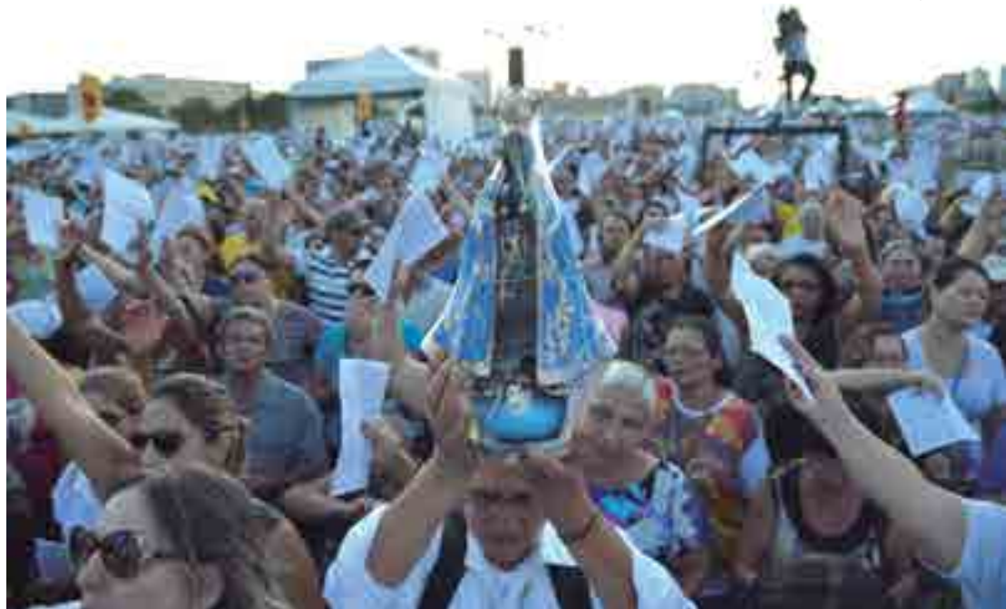
Todos os anos, milhares de fiéis em todo o país celebram e prestam homenagem a Nossa Senhora de Aparecida